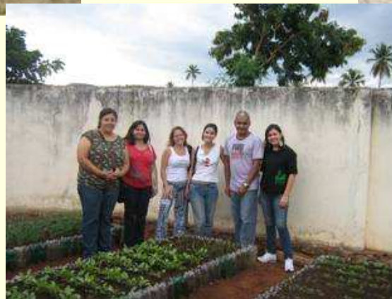
Macaúbas E. M. Laudelino Batista Nobre