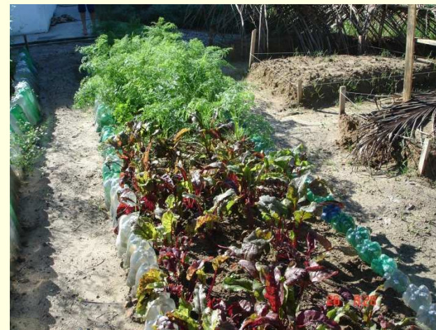
Mata de São João