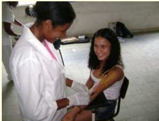
Coleta de sangue em Entre Rios