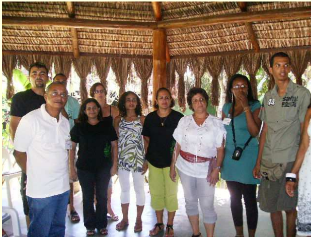
Dinâmica com os coordenadores municipais