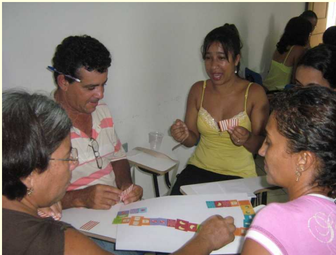
Professores em atividade de apresentação dos jogos de educação nutricional em Macaúbas