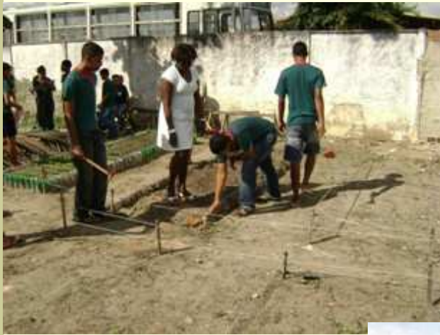
Entre Rios Centro Cultural de ER