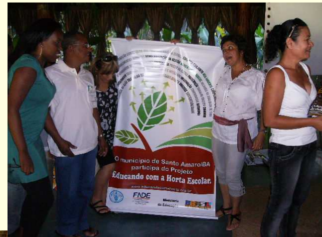
Entrega dos banners aos coordenadores municipais do Projeto