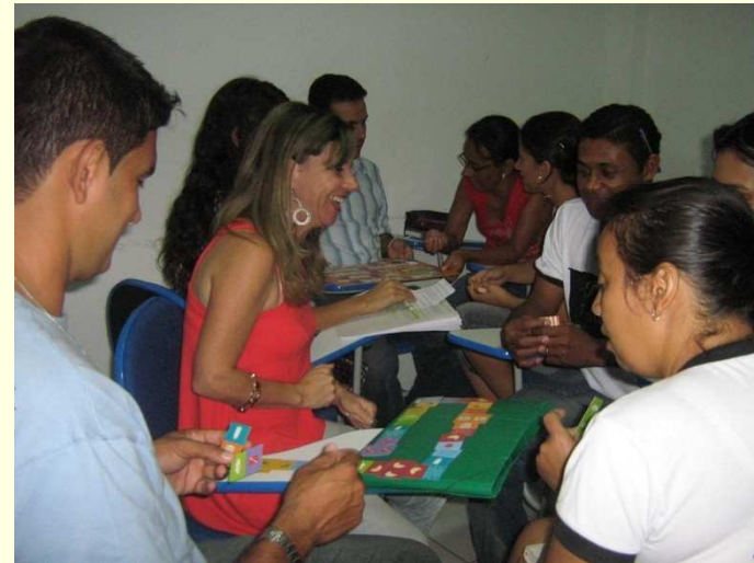
Professores em atividade de apresentação dos jogos de educação nutricional em Piripá