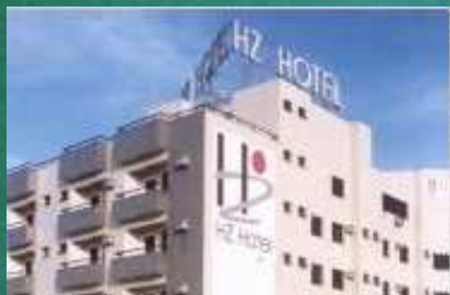
Hotel HZ – Patos de Minas - MG