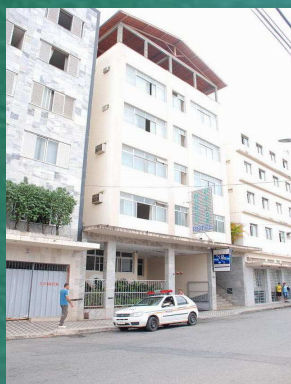
Nobre Palace Hotel – Teófilo Otoni - MG