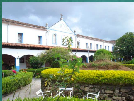
Centro Dom Bosco – Ouro Preto - MG