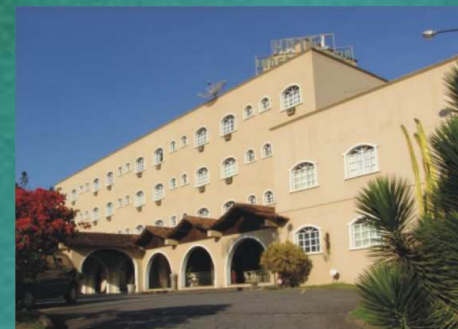
Hotel Independência – Ipatinga - MG

Nos 04, 05 e 06 de junho de 2008, no município de Ipatinga, atingindo as Macrorregião do Rio Doce.