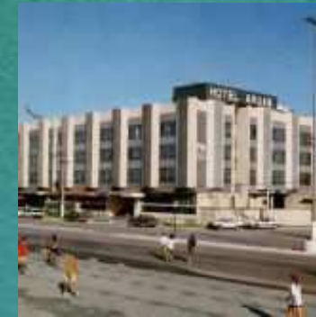
Hotel ARUAN – Praia de Camburi - ES

Estavam presentes neste evento 126 participantes, sendo 52 nutricionistas e 74 conselheiros de CAE, os quais foram distribuídos em três turmas, sendo uma de nutricionistas e duas de conselheiros do CAE, representando 50 municípios.