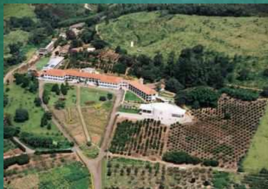
Centro de Convenções Retiro das Rosas